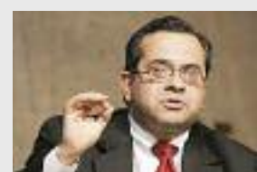
Jaime Saavedra Titular de Educación

“Si juntamos las inversiones previstas y los costos operativos, lo que tenemos hasta este momento estimado es un costo total de S/ 4.125 millones. No queremos volver a venir (al congreso) para informarles un incremento del monto”.